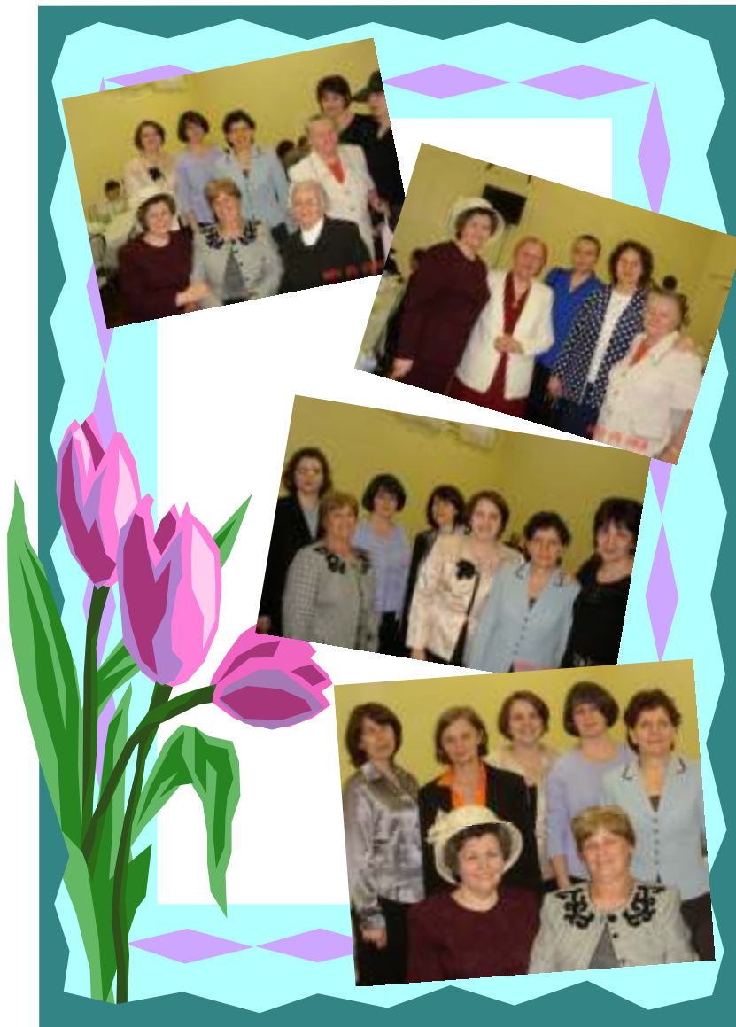
Surori participante la Intrunirea de Primavara de la New York din Mai 23-25, 2008.